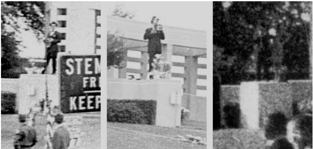
Abb. 1 links bis Abb. 3 rechts: Der Hochgradfreimaurer Abraham Zapruder, gefilmt von der anderen Straßenseite aus, wie er den Mord an John F. Kennedy aufnahm.

Den weltbekannten Zapruder-Film von Abraham Zapruder verkaufte dieser damals für 250.000 Dollar an das Life Magazine , welches einzelne Bilder daraus veröffentlichte. Im Fernsehen wurde die komplette Sequenz erstmals im Jahr 1975 ausgestrahlt. Vor dieser Zeit erhielt die amerikanische Öffentlichkeit lediglich eine Beschreibung der Aufnahmen des CBS-Mitarbeiters Don Rather, der fest behauptete, der Präsident sei nach dem tödlichen Kopfschuss nach vorne und nicht nach hinten gefallen. Interessant hierbei ist, dass Abraham Zapruder, der den bekanntesten Film zum Kennedy-Mord drehte, „zufällig“ selbst Freimaurer des Schottischen Ritus (33°) war.